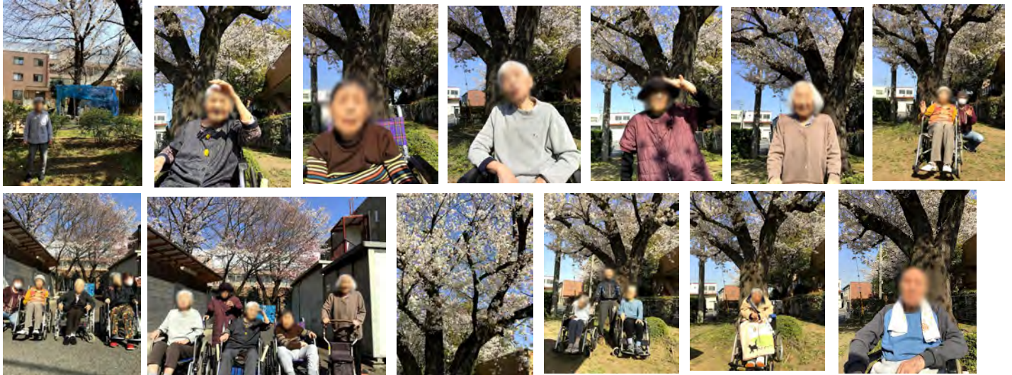
おやつは桜モンブラン♡

コロナに負けず、桜は綺麗に咲いておりました。 隣の第二病院周辺の桜を見にお散歩へ出かけました。